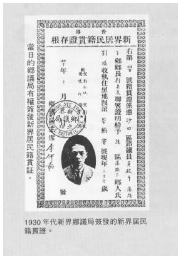
1930 年代新界鄉議局簽發的新界居民籍貫證。