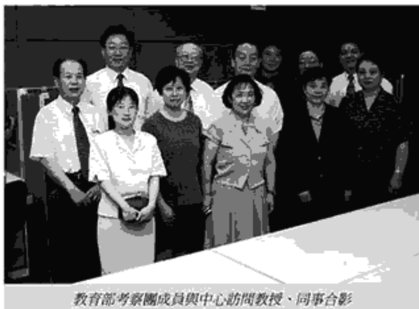
教育部考察團成員與中心訪問教授、同事合影