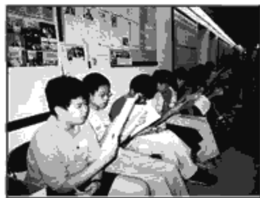
宜基中學升中學生準備普通話摸底測試

本中心支援基督教宣道會宜基中學普通話科教學，提供課程設計及教材編寫的顧問服務，並於8月9日為該校的升中學生進行普通話摸底測試。測試內容分為朗