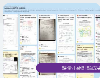
課堂小組討論成果