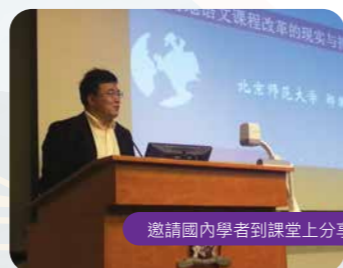
邀請國內學者到課堂上分享