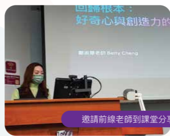
邀請前線老師到課堂分享