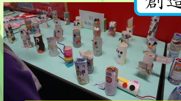
對美和卓越的欣賞