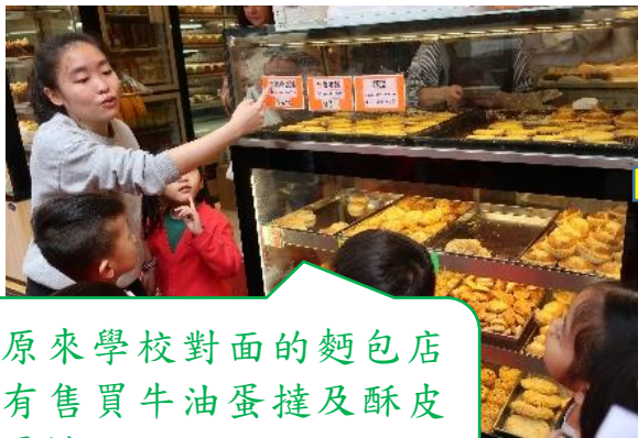
原來學校對面的麵包店有售買牛油蛋撻及酥皮蛋撻