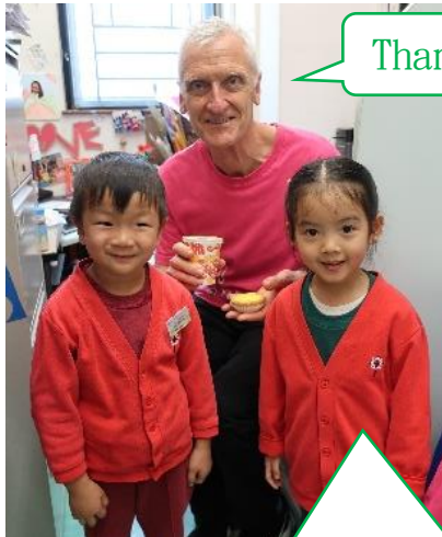
Thank you !