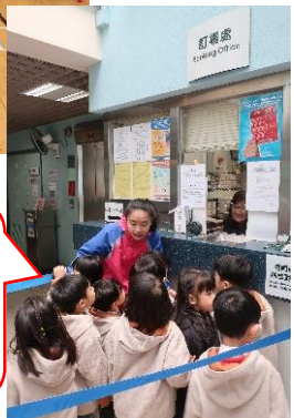
我們可以告訴卓老師，要打羽毛球可以先在訂場處登記。