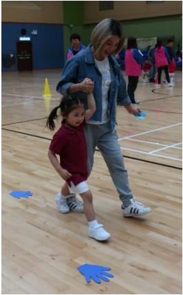
二人三足，將感恩卡傳送！