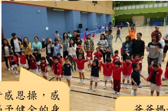
一起進行感恩操，感謝天父賜予健全的身體！