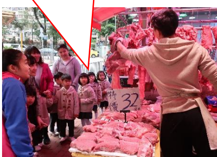
這裏有新鮮的豬肉售賣！