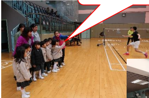
體育館內有羽毛球場呀！