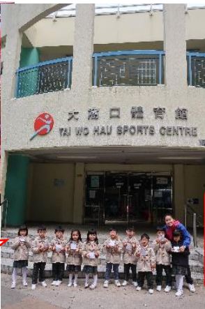
我們的社區有大窩口體育館。