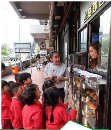
你好！我們想買一杯熱咖啡呀！