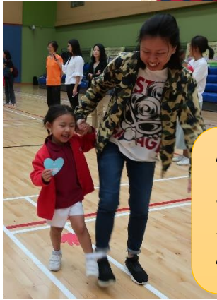
快快貼上感恩卡，與人分享感恩的事情吧！