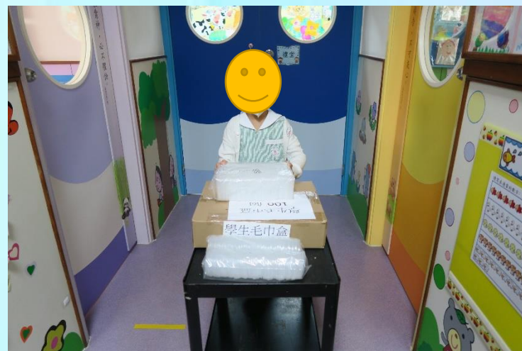
個人點算及搬運物品(要持續性進行)