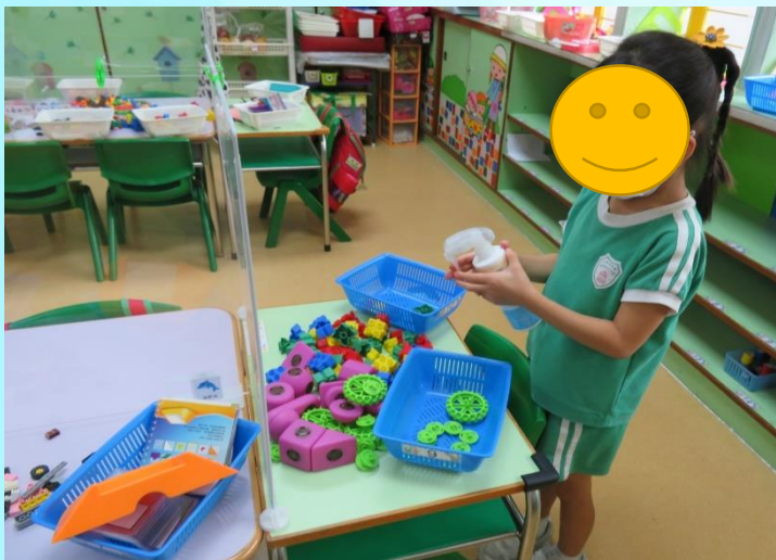
清潔課室玩具，完成後要將玩具整齊放好入櫃