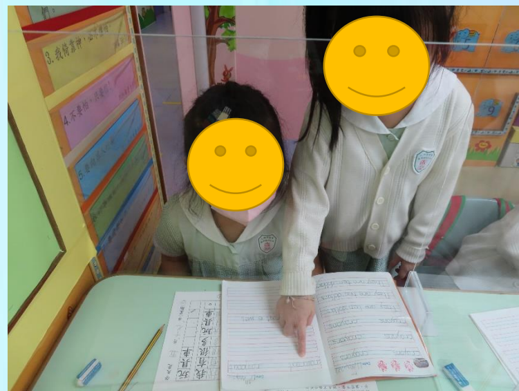
檢查及教導同學功課，完成後， 要做到指定時間(加長時間)