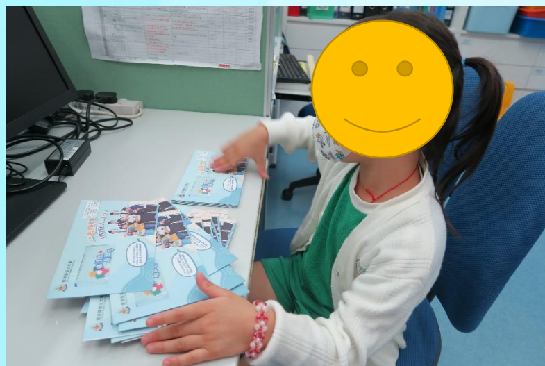
在校務處點算小冊子數量及分派入課室