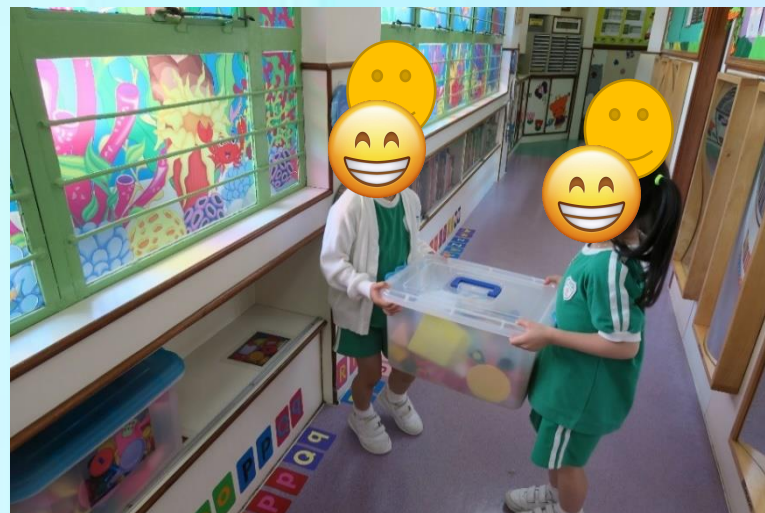
搬運玩具到電子消毒櫃消毒 (每日要負責各班級的玩具)