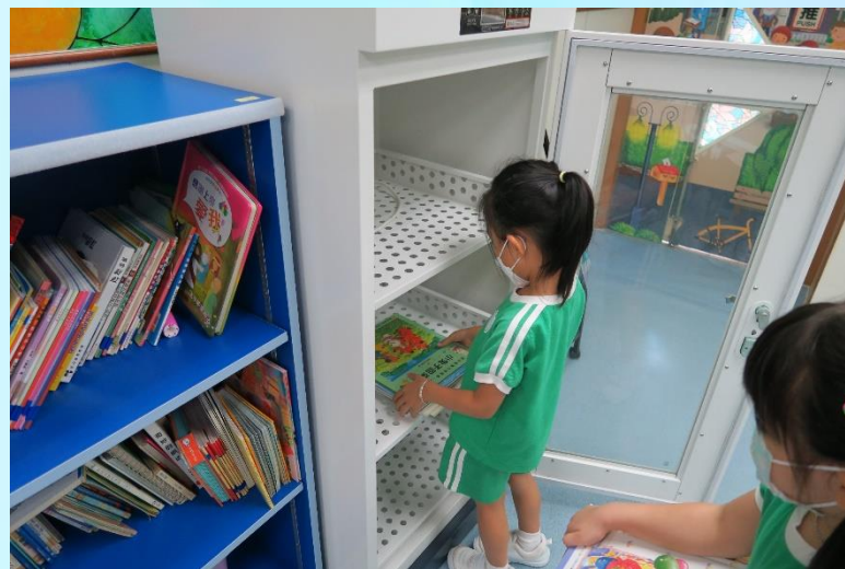
搬運課室圖書到電子消毒櫃消毒