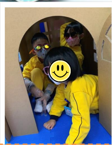
我們模仿長者的生活