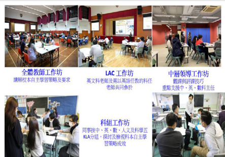
■ 保良局胡忠中學以「如何配合學校的關注事項善用內外資源推動學校作全面改進？」的專題，分享學校要有清晰的發展方向，安排行政及資源配套，並善用校外專業支援，定能有效推動學校改進。