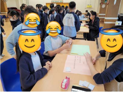
扮演不同年紀、不同身體狀況的老人去求職