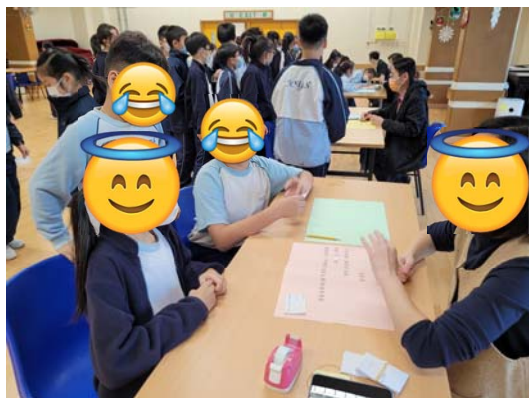
扮演不同年紀、不同身體狀況的老人去求職