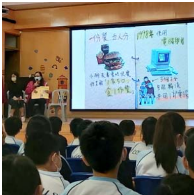
基層人士現身說法加深對貧窮問題的體會和認識