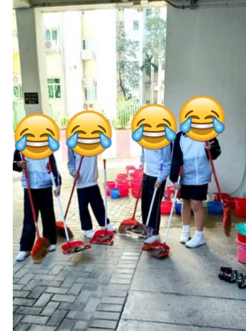
成功求職的都是從事勞動工作，例如清潔工人