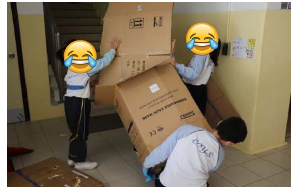
未能入職或入息低微的老人要拾荒維生