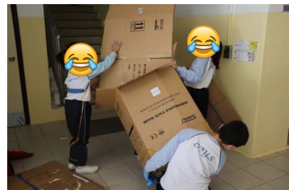
未能入職或入息低微的老人要拾荒維生