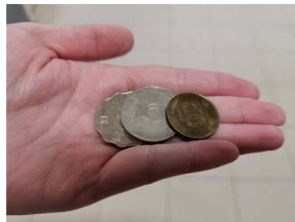
收入只能勉強糊口