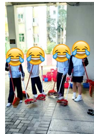
成功求職的都是從事勞動工作，例如清潔工人